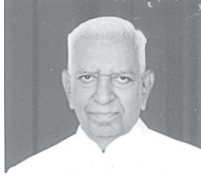
RAJ BHAVAN BANGALORE 12 th Sept., 2014.