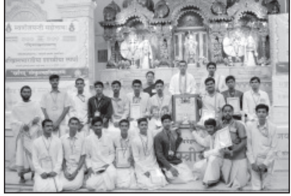
विजयवैजयन्त्या विभूषितः कर्णाटकगणः