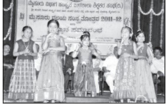
ವಿದ್ಯಾರ್ಥಿನಿಯರಿಂದ ಸಾಂಸ್ಕೃತಿಕ ಕಾರ್ಯಕ್ರಮ