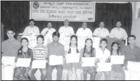
ಸಂಸ್ಕೃತ ಸ್ಪರ್ಧಾ ಕಾರ್ಯಕ್ರಮದಲ್ಲಿ ಅಧ್ಯಾಪಕರೊಂದಿಗೆ ವಿಜೇತರಾದ ವಿದ್ಯಾರ್ಥಿಗಳು.

ದಿನಾಂಕ: 19.12.2011ರಂದು ಸಂಸ್ಕೃತ ಶಿಕ್ಷಣ ನಿರ್ದೇಶನಾಲಯ, ಕರ್ನಾಟಕ ಸಂಸ್ಕೃತ ವಿಶ್ವವಿದ್ಯಾಲಯದ ವತಿಯಿಂದ ಮೈಸೂರು ವಲಯಮಟ್ಟದ 2ನೇ ಹಂತದ (ಮಂಡ್ಯ, ಹಾಸನ, ಚಿಕ್ಕಮಗಳೂರು, ದಕ್ಷಿಣ ಕನ್ನಡ, ಉಡುಪಿ ಜಿಲ್ಲೆ) ಸಂಸ್ಕೃತ ಪಾಠಶಾಲಾ/ಕಾಲೇಜುಗಳ ವಿದ್ಯಾರ್ಥಿಗಳಿಗೆ ವಿವಿಧ ಸ್ಪರ್ಧೆಗಳನ್ನು ಹಾಸನ ಸಂಸ್ಕೃತ ಪಾಠಶಾಲೆಯಲ್ಲಿ