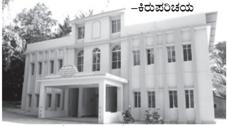
ಶ್ರೀ ಮೇಧಾ ದಕ್ಷಿಣಾಮೂರ್ತಿ ವೇದಭವನ ವಿದ್ಯಾಲಯ

ಗೋಕರ್ಣ 'ದಕ್ಷಿಣಕಾಶಿ' ಎಂದೇ ಖ್ಯಾತವಾದ ಐತಿಹಾಸಿಕ ಹಾಗೂ ಪುರಾಣಪ್ರಸಿದ್ಧಕ್ಷೇತ್ರ. ಅಷ್ಟೇ ಅಲ್ಲ ಮಂತ್ರವಿದರ ನಾಡೂ ಹೌದು. ಅಂತಾರಾಷ್ಟ್ರೀಯ ಪ್ರಸಿದ್ಧಿಪಡೆದ ಮಂತ್ರದ್ರಷ್ಟಾರರು, ಯಾಜ್ಞಕಪ್ರಕ್ರಿಯಾ ಪರಿಣತರು, ಗಣಿತಜ್ಞರು ಮತ್ತು ಚಿಂತಕರಿಗೆ ಜನ್ಮನೀಡಿದ ಭೂಮಿಯಿದು.