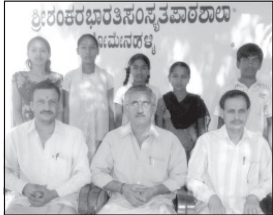
22.12.2011ರಂದು ಸಂಸ್ಕೃತ ಶಿಕ್ಷಣ ನಿರ್ದೇಶನಾಲಯದ ವತಿಯಿಂದ ಸಂಸ್ಕೃತ ಪಾಠಶಾಲಾ ವಿದ್ಯಾರ್ಥಿಗಳಿಗಾಗಿ ಯಡಿಯೂರಿನ ವೇದಾಗಮ ಸಂಸ್ಕೃತ ಪಾಠಶಾಲೆಯಲ್ಲಿ ಏರ್ಪಡಿಸಿದ್ದ ಸ್ಪರ್ಧೆಗಳಲ್ಲಿ ಸೋಮೇನಹಳ್ಳಿಯ ಶ್ರೀ ಶಂಕರ ಭಾರತಿ ಸಂಸ್ಕೃತ ಪಾಠಶಾಲೆಯ ವಿದ್ಯಾರ್ಥಿಗಳು ವಿಜೇತರಾಗಿ, ರಾಜ್ಯಮಟ್ಟದ ಸ್ಪರ್ಧೆಗಳಿಗೆ ಆಯ್ಕೆಯಾಗಿದ್ದಾರೆ.