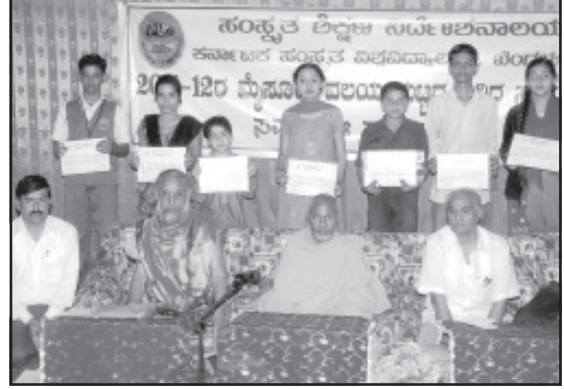
ಸಂಸ್ಕೃತ ಸ್ಪರ್ಧಾ ಕಾರ್ಯಕ್ರಮದಲ್ಲಿ ವಿಜೇತರಾದ ವಿದ್ಯಾರ್ಥಿಗಳು.