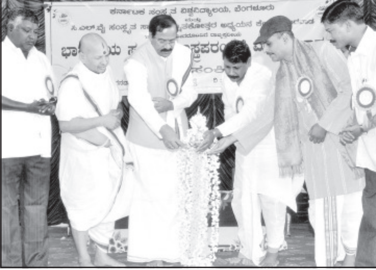
ಶಾಸ್ತ್ರಪರಂಪರೆ ಮತ್ತು ವಿಜ್ಞಾನ ಕುರಿತ ವಿಚಾರ ಸಂಕಿರಣದ ಉದ್ಘಾಟನೆ ಕುಲಪತಿಗಳಿಂದ.