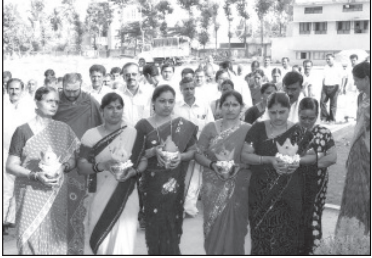
ಸಮಾರೋಪ ಸಮಾರಂಭಕ್ಕೆ ಆಗಮಿಸುತ್ತಿರುವ ಗಣ್ಯರಿಗೆ ಪೂರ್ಣಕುಂಭ ಸ್ವಾಗತ.